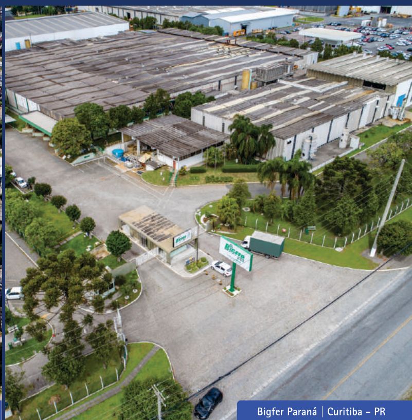
Bigfer Paraná | Curitiba - PR