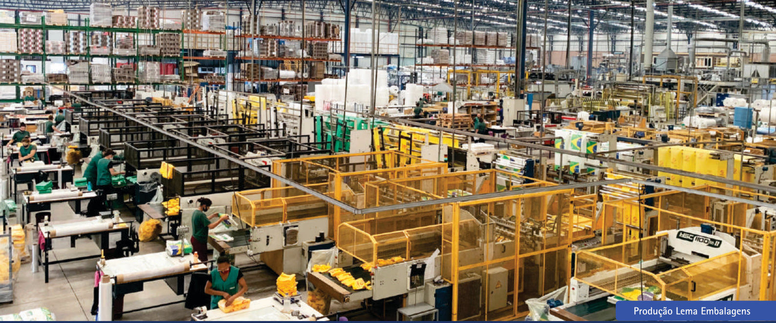
Produção Lema Embalagens