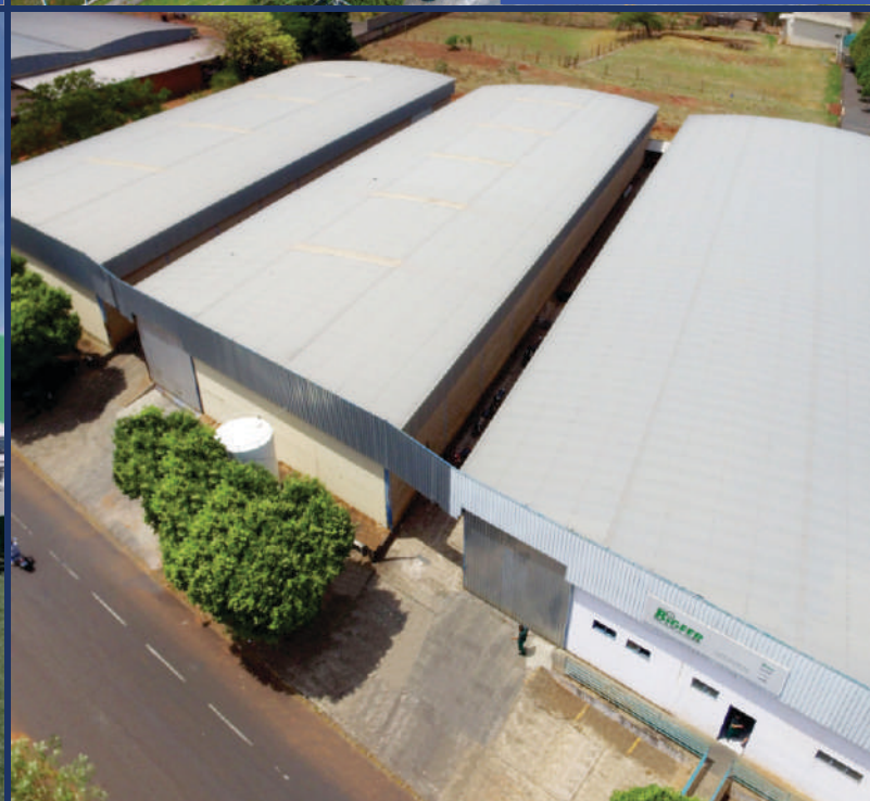
Bigfer São Paulo | Votuporanga - SP