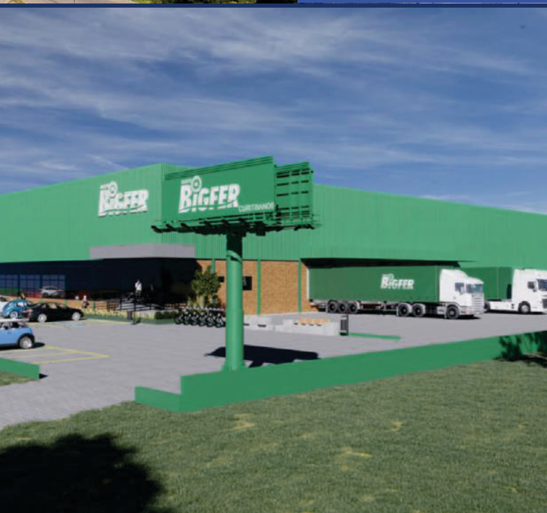
Bigfer Curitiba | Curitiba - SC