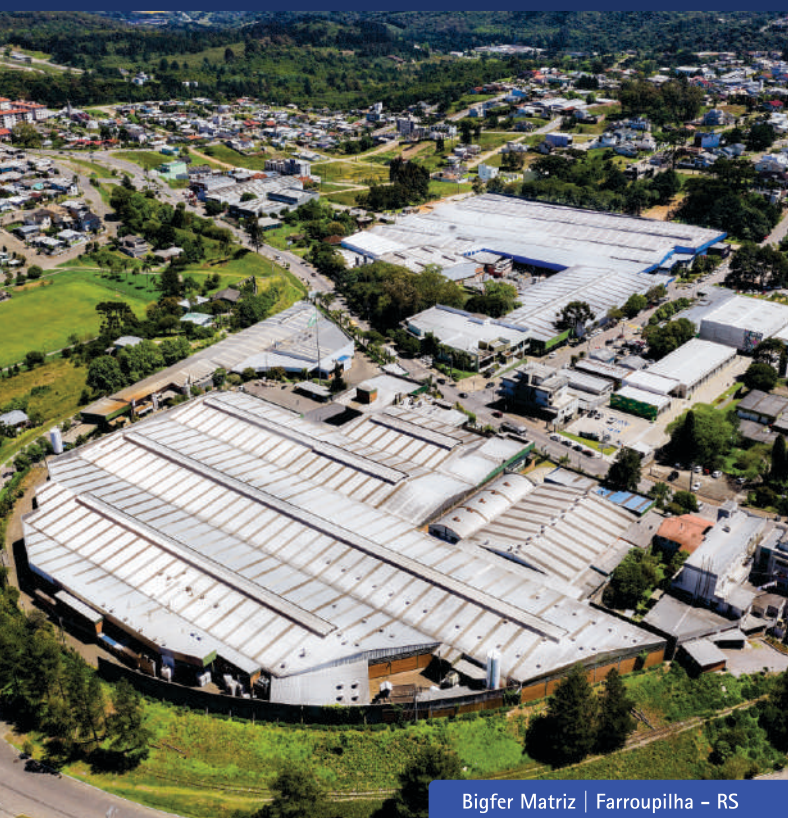
Bigfer Matriz | Farroupilha - RS

Atualmente, o Grupo Bigfer conta com mais de 10 mil itens ativos em seus catálogos, cerca de 2.000 colaboradores e possui uma área construída com cerca de 100.000m 2 .