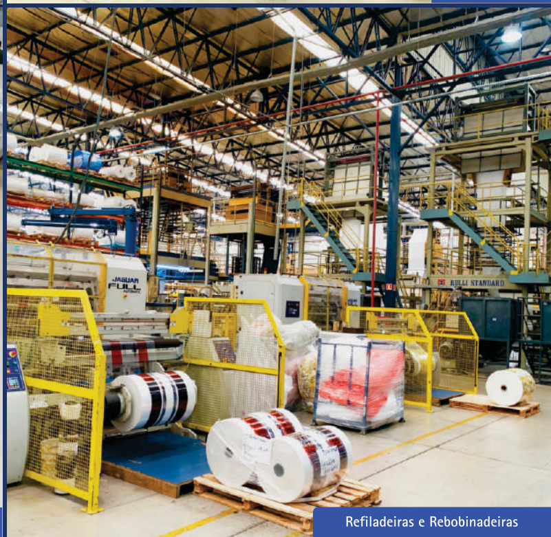
Refiladeiras e Rebobinadeiras